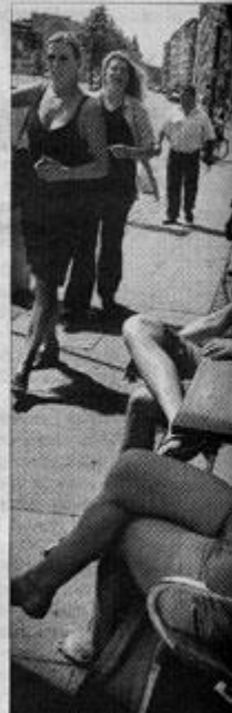
Det er ikke så længe siden, at gader var forbeholdt ludere, i er området via byfornyelsen i de steder at bo og gå i byen.