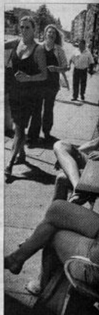
Det er ikke så længe siden, i gader var forbeholdt ladere, i er området via byfornyelsen i de steder at bo og gå i byen.