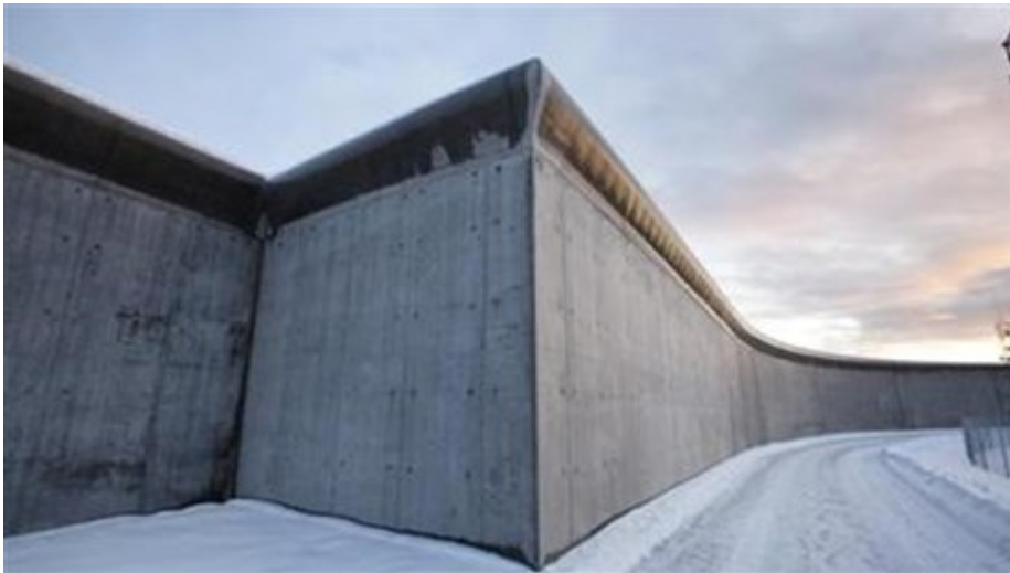
Halden fængsel er omringet af en høj betonmur. (Foto: © Erik Møller Arkitekter)

Ikke desto mindre skal man forsøge at mindske skadevirkningerne af at være i fængsel samt skabe gode muligheder for, at de indsatte kan vende tilbage til samfundet, mener han.